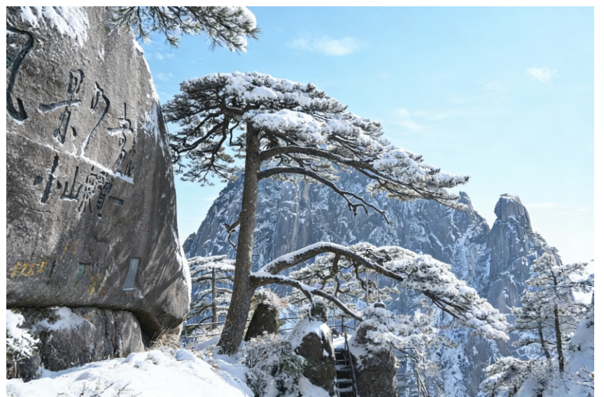
雪覆奇松石映诗，群峰素裹画中痴。